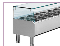
Pés em aço inox

Os Kits Refrigerados são utilizados não apenas na conservação dos ingredientes para a pizza, mas também no serviço fast-food e snack. As suas reduzidas dimensões permitem uma fácil colocação mesmo nos espaços mais exíguos.