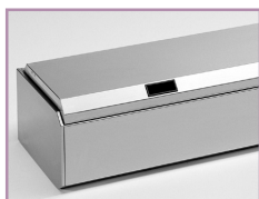
Campânula em aço inox