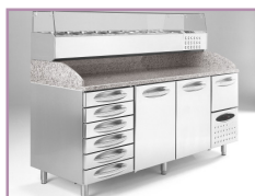
Compatível com todas as bancadas