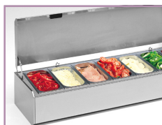
Interior permite a inserção de contentores GN