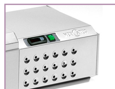
Painel de control electrónico