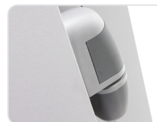
Special hinge with slope