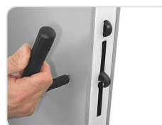
Key to tighten the camlocks