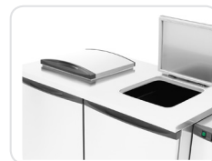
Fácil acesso através das tampas estanques