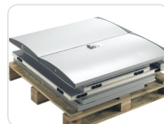
Painéis modulares com embalagem compacta