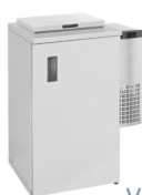
V5C-1 | V6-1

V6 | Grupo Enfriador Monobloque - El grupo enfriador monobloque combina un alto rendimiento con un bajo consumo, y su instalación es extremadamente simple y de enchufe normal.