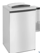
V5-1 | V6-1