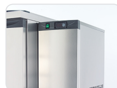
Encaixe lateral de montagem fácil e rápida

V5 | Câmara de Detritos - Os refrigeradores de detritos são o equipamento ideal para cozinhas profissionais e outros ambientes bacteriológicamente sensíveis, pela segurança que proporcionam e pela utilização prática que oferecem.