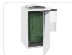
Interior dimensionado para contentores de 240 L