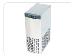
Grupo refrigerador monobloco de alto rendimento