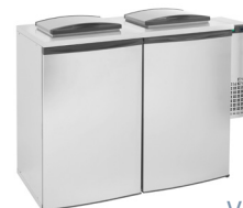
V5-2 | V6-2