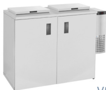
V5C-2 | V6-2